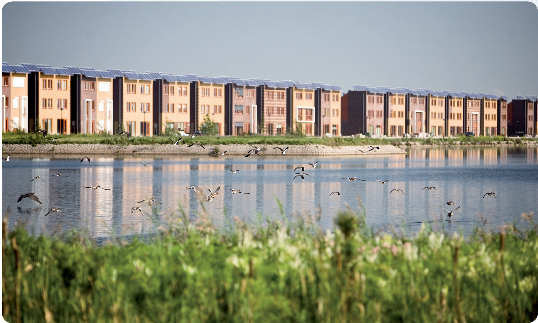
Ruimtelijk wonen in Heerhugowaard