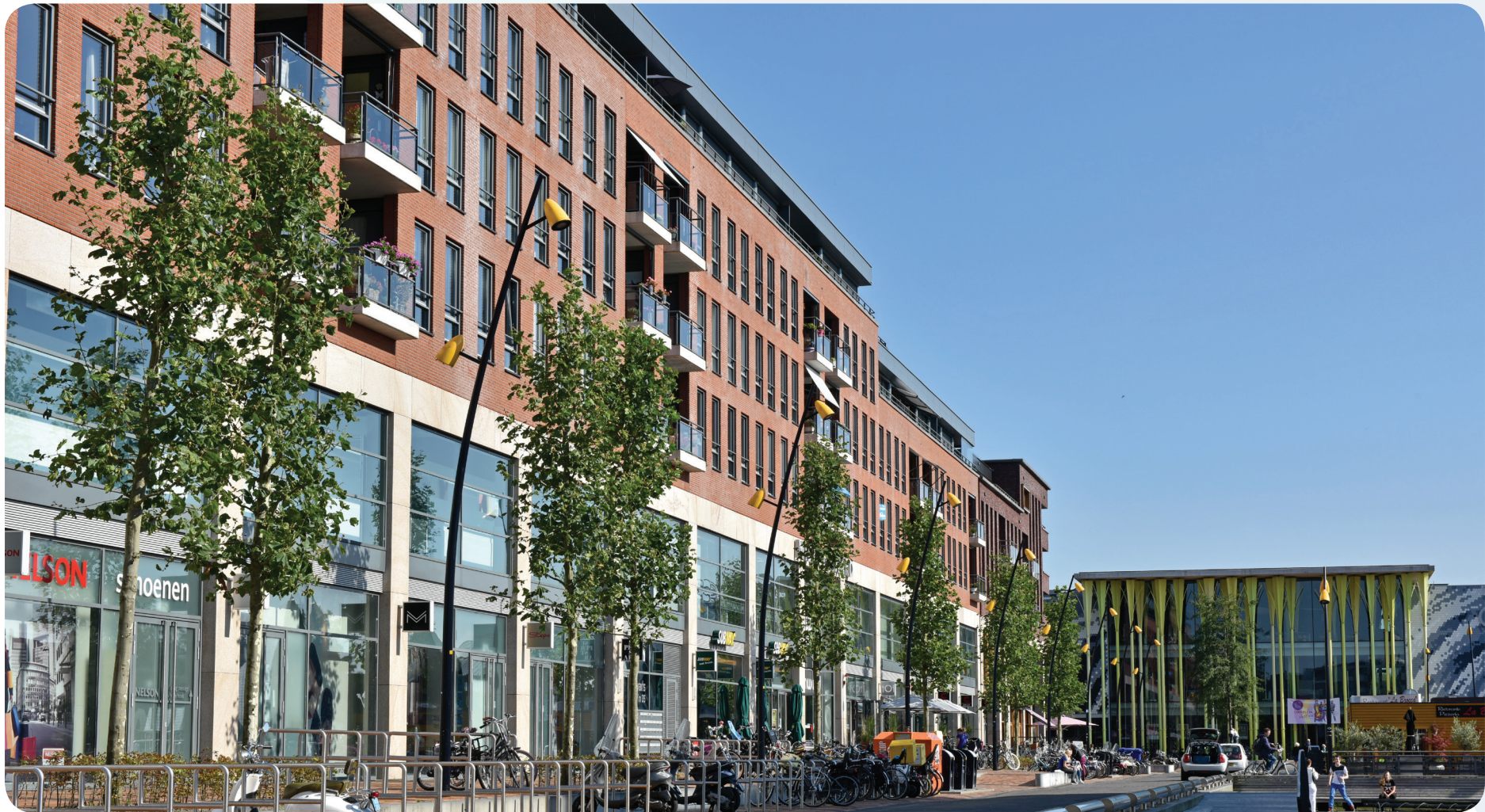
Een mix aan winkels, voorzieningen en dienstverlenende bedrijven.