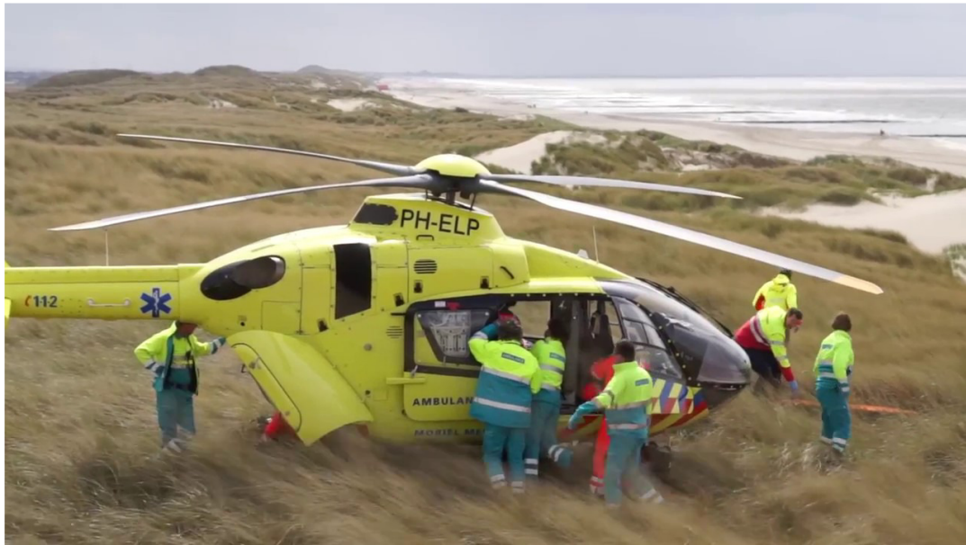
Een paraglider viel eind april van grote hoogte in de duinen bij Julianadorp.