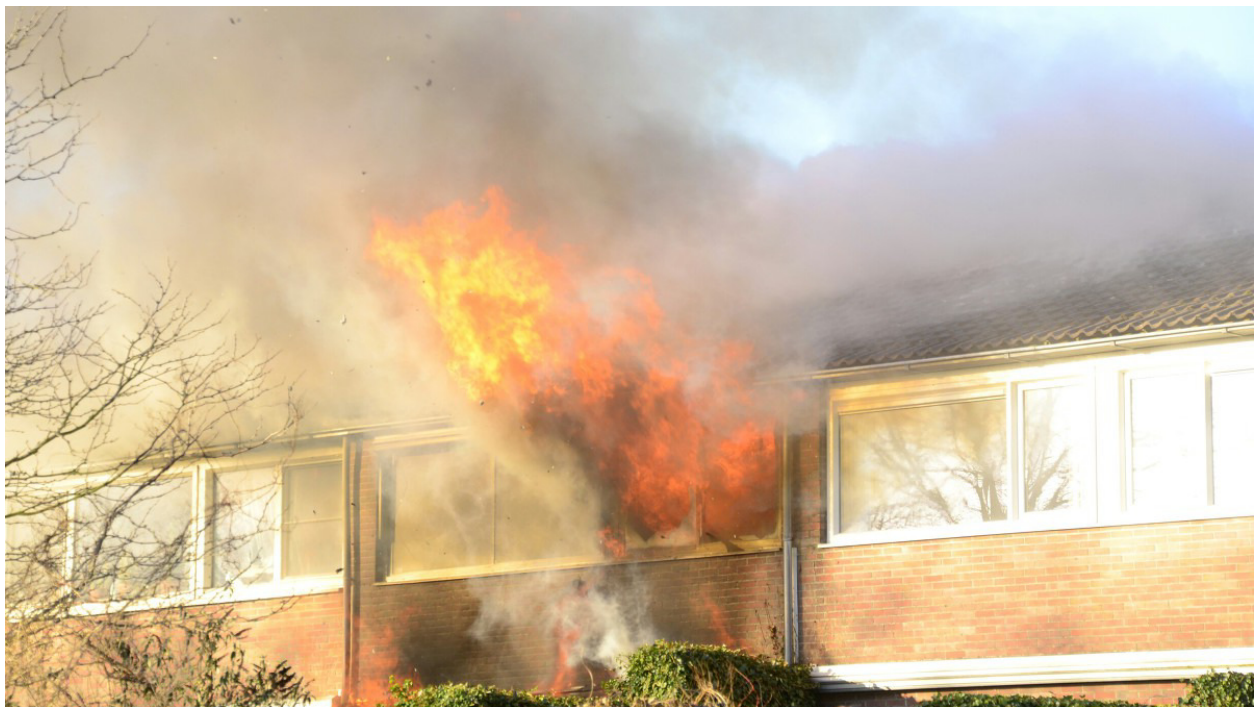
Een felle, uitslaande brand in een rijtjeshuis in Hoorn waarbij de oudere vrouw en haar hondjes de brand niet overleefden.

Het jaar 2017 begon heftig voor de bewoners van de Schepenen in Hoorn. Overdag op 5 januari ontstaat een felle, uitslaande brand in een van de rijtjeshuizen. De brandweer schaalte op naar GRIP 1 en vreest dat het vuur overslaat. Dat gebeurt helaas ook. De burens moeten hun huis verlaten en worden opgevangen in wijkcentrum Huesmolen. Daar komt ook slachtofferhulp naartoe. De woning waar de brand begon brandt volledig uit. In het uitgebrande pand vindt de brandweer het stoffelijk overschot van de oude buurvrouw. Ook haar beide hondjes overleven de brand niet. De huizen links en rechts naast de uitgebrande woning zijn ook flink beschadigd. De beide buurfamilies kunnen daardoor lange tijd niet terug naar hun huis.