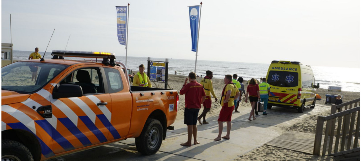
Twee negentienjarige jongens gingen met de ambulance mee naar het ziekenhuis voor controle.

De Reddingsbrigade Den Helder redde maandag 21 augustus samen met andere hulpdiensten dertien mensen uit zee. De drukke dag eindigde met een groepje van vier jongens dat aan het begin van de avond aan het zwemmen was ter hoogte van de Huisduinen. Een omstander zag dat ze in de problemen waren en belde 112. Twee negentienjarige jongens waren onder water geraakt en hadden mogelijk water binnengekregen. Daarom gingen ze ter controle met de ambulance mee naar het ziekenhuis.