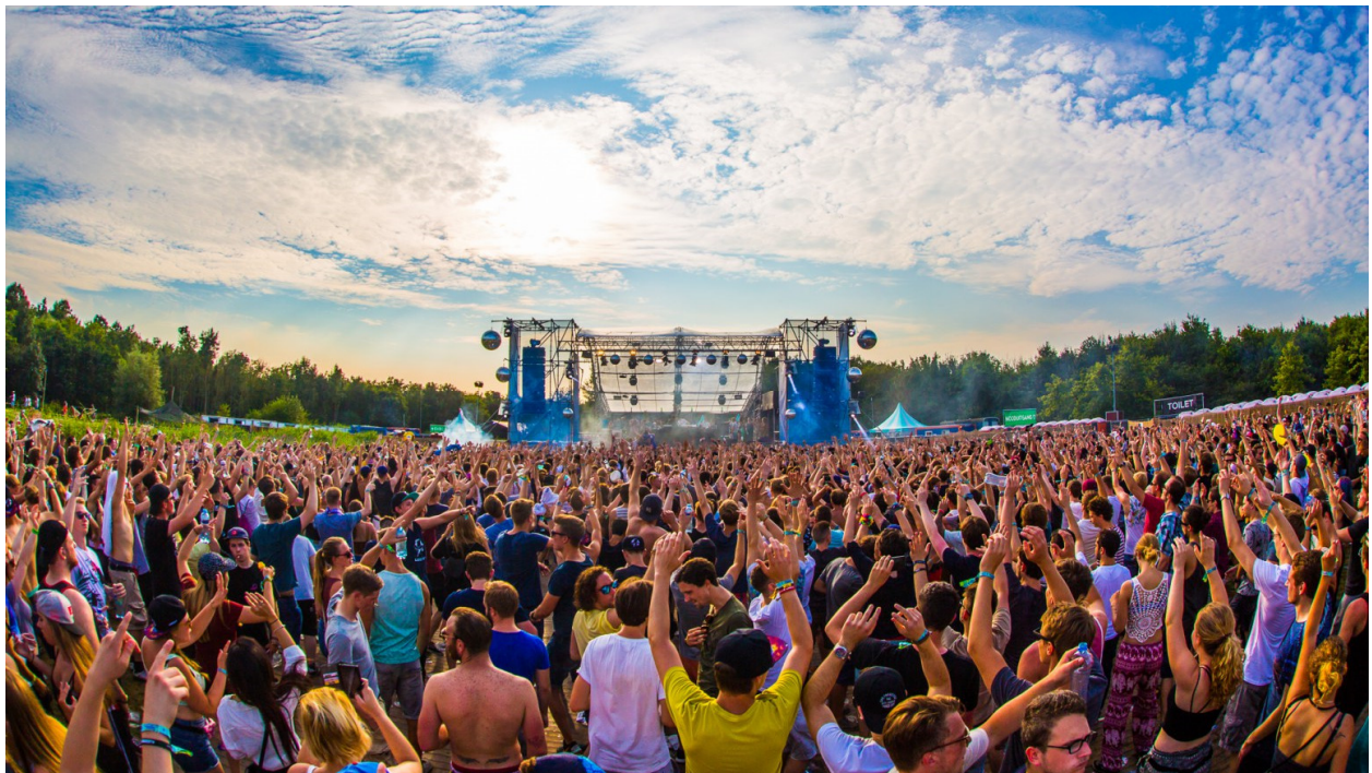
Liquicity Festival in recreatiegebied Geestmerambacht in de gemeente Langedijk.

Een paar dagen voor het evenement organiseerden we op het terrein een bijeenkomst met tabletop-oefening voor alle hulpdiensten en de organisatie. Alle evenementen brengen risico's met zich mee, maar op deze manier beperken we de risico's zoveel mogelijk. Tijdens het evenement richtten we een centrale post in, waaruit de beveiliging, mobiliteit en EHBO gemonitord wordt. De hulpverleningsketen, inclusief meldkamer, brengen we vooraf op de hoogte van het evenement. In LCMS (Landelijk Crisismanagement Systeem) delen we de informatie met alle hulpdiensten. Het evenement is heel goed verlopen. Wat kleine incidentjes zijn door de organisatie zelf afgehandeld.