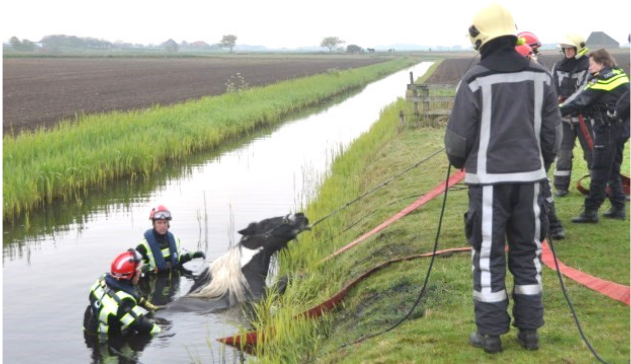
Het paard was in de modderige sloot terecht gekomen en kon niet meer op eigen kracht uit het water.

De brandweer redde dinsdagochtend 2 mei 2017 een paard uit een sloot langs de Westerweg tussen Den Burg en Den Hoorn. Twee mensen van de brandweer gingen te water, terwijl vanaf de kant brandweer en politie hielpen om het hoofd van het paard boven water te houden. Met behulp van een trekker werd hij terug op de wal getild, waar het vermoede paard met dekens werd opgewarmd.