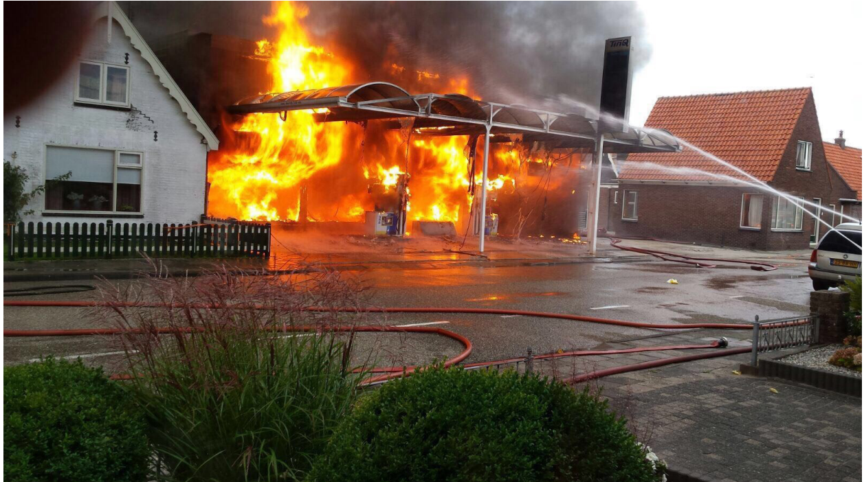
De garage en benzinepomp in 't Zand brandden deze zomer volledig uit. De rookwolken waren in de wijde omtrek te zien.