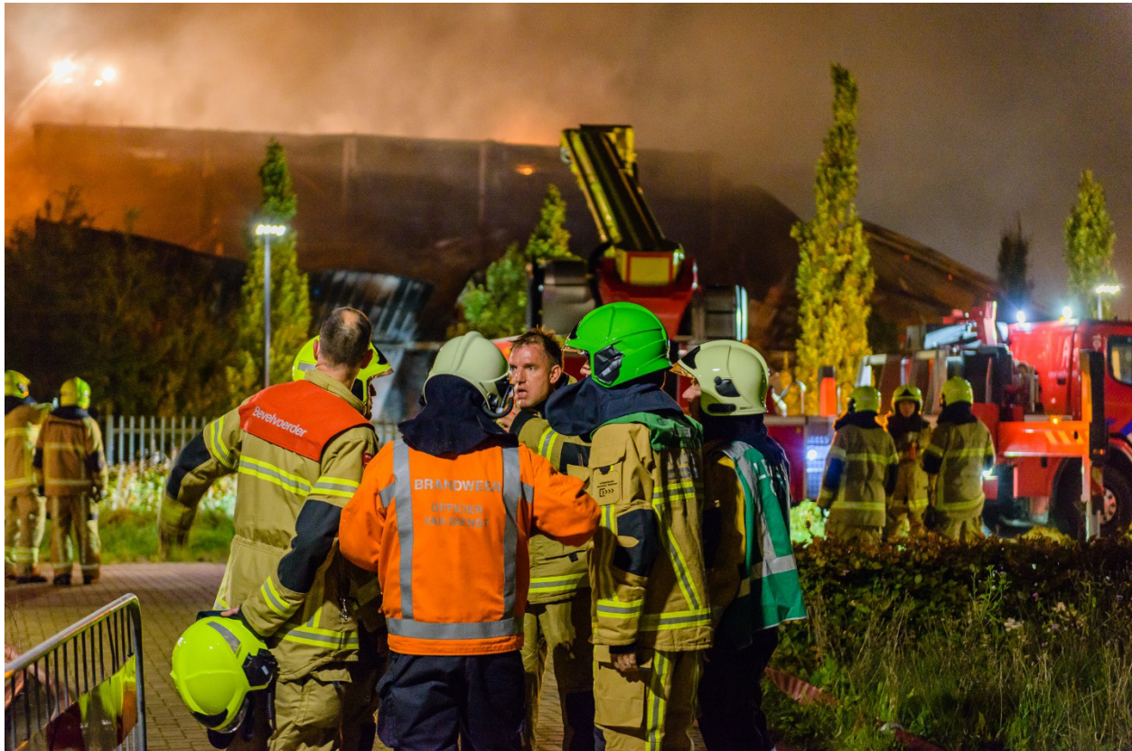
Helaas werd het hele sportcentrum De Beeck door de brand verwoest.

In de nacht van donderdag 12 op vrijdag 13 oktober 2017 schrok een deel van Bergen wakker door brandweersirenes. Nabijgelegen appartementen werden ontruimd, maar gelukkig konden de bewoners weer snel terug naar hun bed. De appartementen lagen namelijk niet in de rook. De brandweer kreeg bij het blussen assistentie van een aantal hoge sloopkranen. Helaas is het complex helemaal verwoest. De brand heeft veel impact op het dorp. Het sportcomplex was een centraal punt, waar veel mensen heen gingen om te sporten, zwemmen of vergaderen. Ook voor de gemeenteraadsvergaderingen moest een andere locatie gezocht worden.