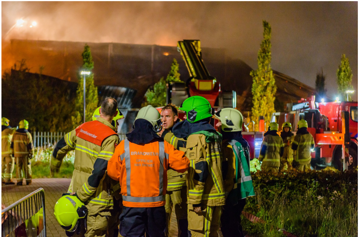
Zeer grote brand in zwembad en sportcentrum De Beeck in Bergen in de nacht van vrijdag 13 oktober.

In dit dagboek leest u wat we doen voor uw inwoners. Wat we doen om leed en schade te voorkomen en te beperken. Want iedere dag werken we samen met inwoners en ketenpartners aan veiliger leven, veiligere gebouwen, veilige evenementen en goede hulpverlening. We werken samen tijdens een crisis en we brengen hulpverleners samen in het Veiligheidshuis om sociale problemen op te lossen. Wilt u weten wat we het afgelopen jaar voor uw gemeente hebben gedaan? Speciaal over uw gemeente vindt u verhalen en cijfers op de website https://mijngemeente.vrnhn.nl/