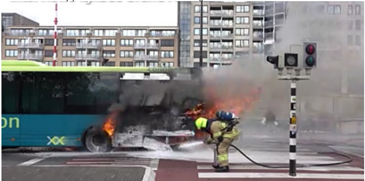
Alle inzittenden konden op tijd de bus uit. Er zijn geen gewonden gevallen.

Een lijnbus vloog zondagmiddag 17 september plotseling in brand op de Kanaalkade. De brand ontstond nadat de buschauffeur wilde optrekken. De bus stotterde en viel uit. Eén van de passagiers achterin de bus rook vervolgens een brandlucht, wat de chauffeur deed besluiten om alle passagiers uit de bus te halen. Toen de chauffeur de achterzijde van de bus controleerde vatte het voertuig vlam. In totaal zaten er vijf personen in de bus. Niemand raakte gewond. De brandweer kon de bus blussen.