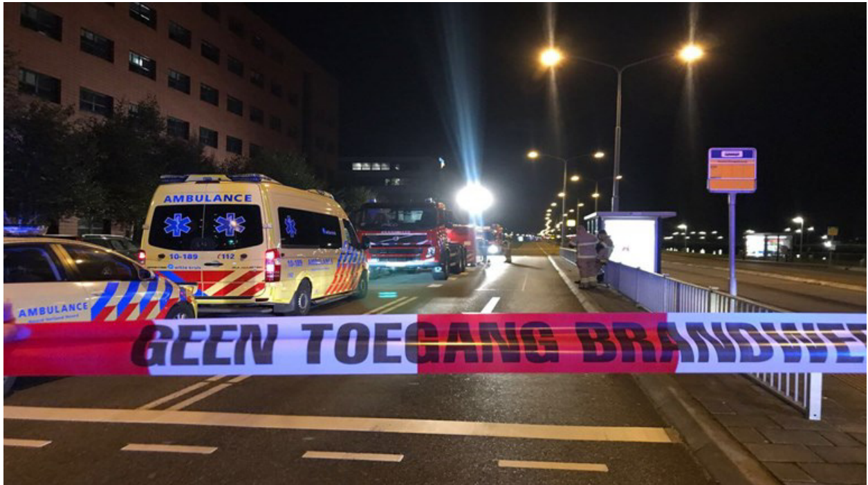
Gebied afgezet en ontruimd vanwege groot gaslek aan de Helderseweg in Alkmaar op 18 oktober 2017.

Dit incident had veel impact op de omgeving en inwoners van Alkmaar. We beschreven het van begin tot eind in een artikel in Code Oranje : het online magazine over het expertteam Bevolkingszorg, dat gemeenten ondersteunt bij de hulp aan inwoners tijdens kleine en grote incidenten.