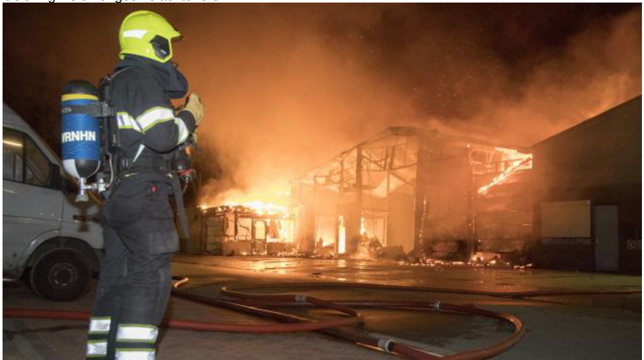
Nadat de brandweer dacht het vuur onder controle te hebben, laaide het rond 3.00 uur 's nachts toch weer op. De brandweer is nog enkele uren bezig geweest met nablussen.

Tijdens de zomervakantie in augustus woedde een zeer grote brand op het bedrijventerrein aan de Madame Curiestraat in Alkmaar. Meerdere loodsen stonden in brand en korpsen uit heel Noord-Holland Noord rukten uit om de vuurzee te bestrijden. Over de wijk Oudorp trok veel rook, daarom is vanaf de meldkamer een NL-Alert verstuurd. Omwonenden adviseerden we ramen en deuren te sluiten en de ventilatie uit te zetten. In een straal van 50 meter rond de brand is asbest gevonden. Gelukkig vielen er geen slachtoffers.