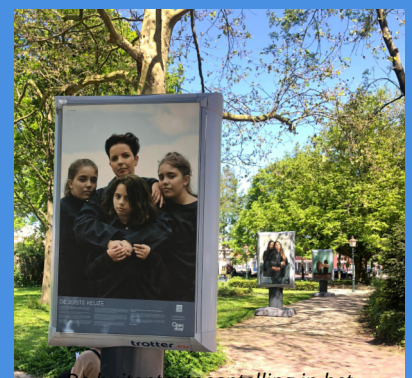
De buitententoonstelling in het noorderplantsoen van Hoorn