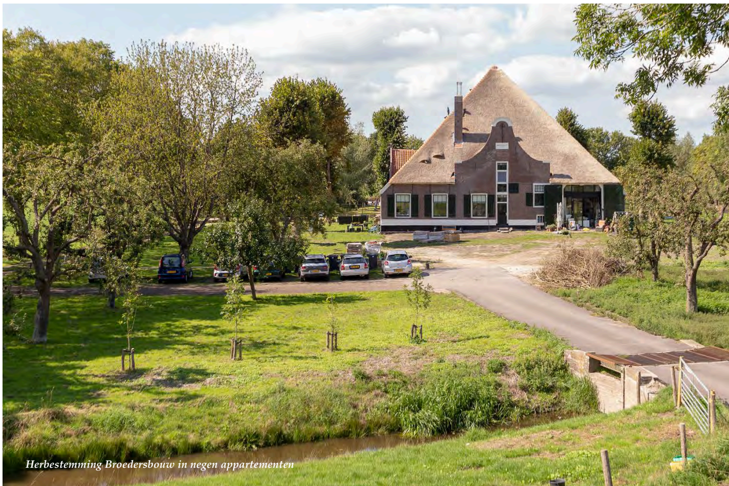
Herbestemming Broedersbouw in negen appartementen