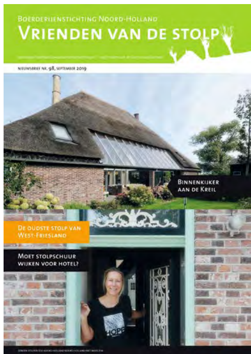
Nieuwsbrief nr. 98