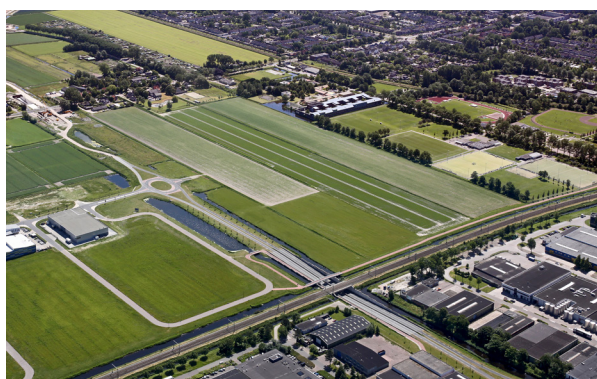
Figuur 1: Plangebied De Vaandel Zuid.

Binnen het onderzoek is gekozen voor De Vaandel Zuid in Heerhugowaard als onderzoeksgebied, omdat daar de ontwikkelingen nog niet vast liggen en er met de invulling van het gebied duurzame ambities nagestreefd worden. De doelstelling is om aan de hand van een te ontwikkelen ambitieladder aanvullingen te doen op de huidige ontwikkelingen voor een groene en gezonde inrichting van het plangebied. Daarnaast wordt gekeken wat de ladder voor toekomstige ruimtelijke ontwikkelingen binnen de gemeente kan betekenen.