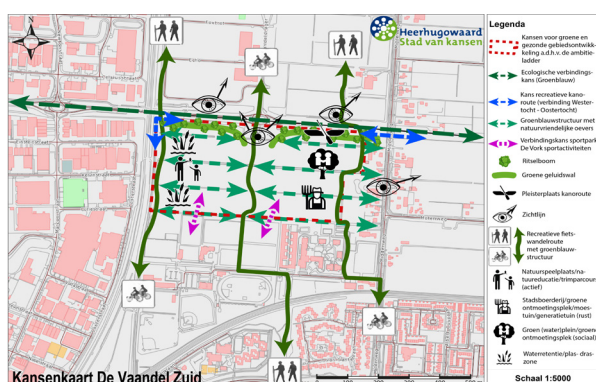
Figuur 3: Kansenkaart De Vaandel Zuid.

Geconcludeerd kan worden dat de ambitieladder een waardevolle aanvulling is op de doelstellingen van de stichtingen en bedrijven die zich op De Vaandel Zuid willen vestigen, omdat deze bijdraagt aan de gezondheid van werknemers en cliënten. Daarnaast wordt er door de te realiseren groenblauwstructuren gezorgd dat het plangebied een verbindende wijk wordt tussen de stad en het (recreatieve) buitengebied. De ambitieladder kan daarnaast gebruikt worden om in gesprek te gaan met initiatiefnemers en om beleidsuitgangspunten voor de gemeente op te stellen.