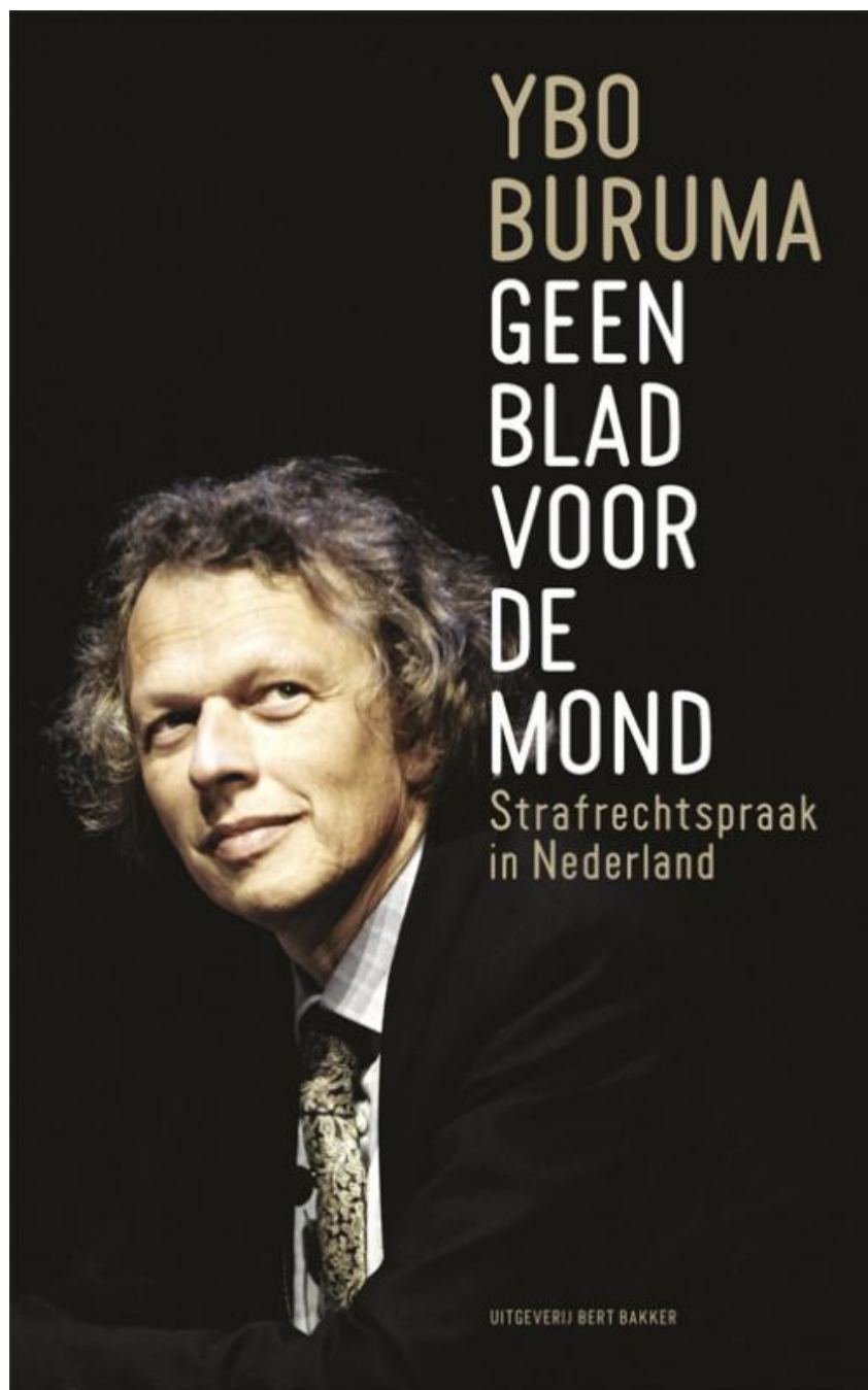
Beeld: uitgeverij Bert Bakker