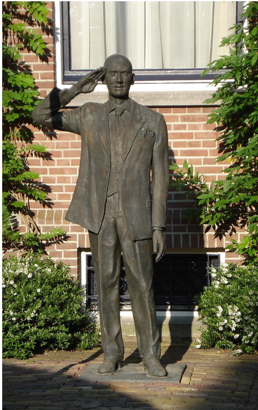
Pim Fortuyn (1948-2002)