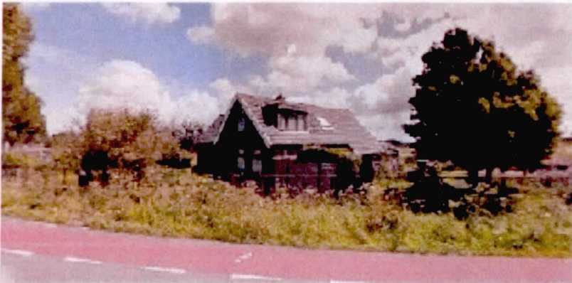
Middenweg 2 1703 RC Heerhugowaard