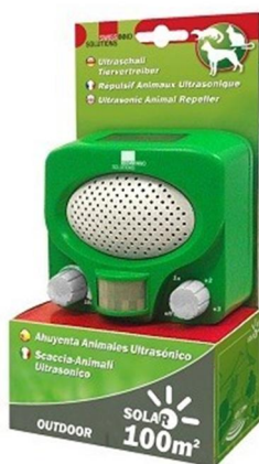
Fig: Een kattenverjager voor particulier gebruik van nog geen €50

Mosquitosystemen zijn er echter ook in toenemende mate in de handel verkrijgbaar als particuliere versie meestal als doel om katten uit tuinen te weren. Tegenwoordig is een dergelijk apparaat al voor nog geen € 50 te koop voor privégebruik. We hebben sterk het gevoel dat de klachten over het gebruik van dit soort systemen aan het toenemen zijn.