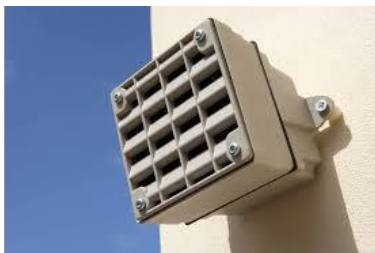
Fig: Een professioneel systeem tegen hanggroepjongeren dat vaak in de openbare ruimte wordt gebruikt

Professionele mosquitosystemen zijn in de afgelopen jaren in meer dan 100 gemeenten in de openbare ruimte gebruikt als middel om lokaal overlast van hanggroepjongeren te bestrijden. Doordat locatie, gebruiksfrequentie, tijdstip van gebruik onder overheidscontroleplaatsvindt zijn de negatieve effecten redelijk geborgd, al zijn er ook zeker in dergelijke situaties klachten en (principiële) tegenstanders die vinden dat je goedwillende mensen en jeugdigen zo niet uit de openbare ruimte moet weren. Er zijn ook de nodige gemeenten die daarom het gebruik weer hebben afgeschaald op zelfs stopgezet.