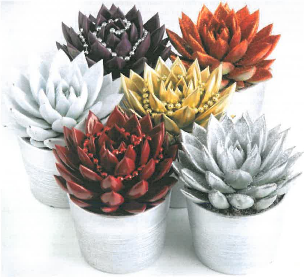
decoratieve ensembles van Amigo Plant