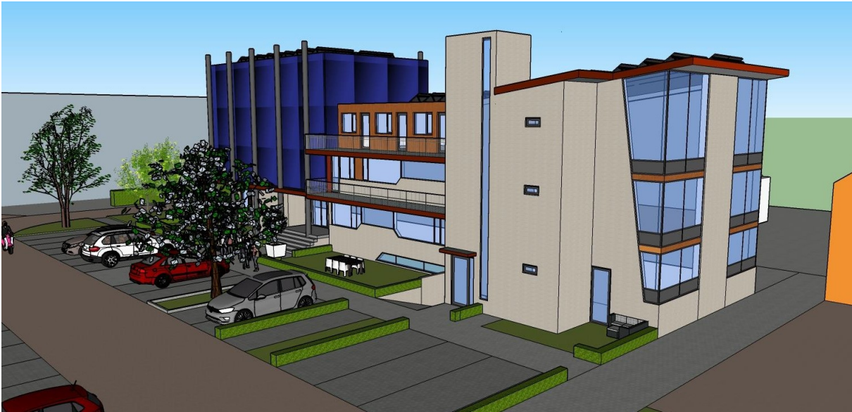
Het schetsontwerp van de initiatiefnemers. Dit wordt de komende tijd op basis van de intentieovereenkomst verder uitgewerkt.