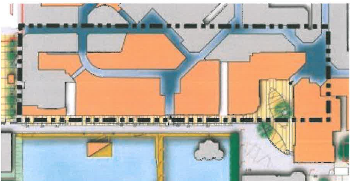
Weergave zonegrens uit bestemmingsplan Stadshart op topografische ondergrond

in de bestemming Centrumdoeleinden C Centrumdoeleinden