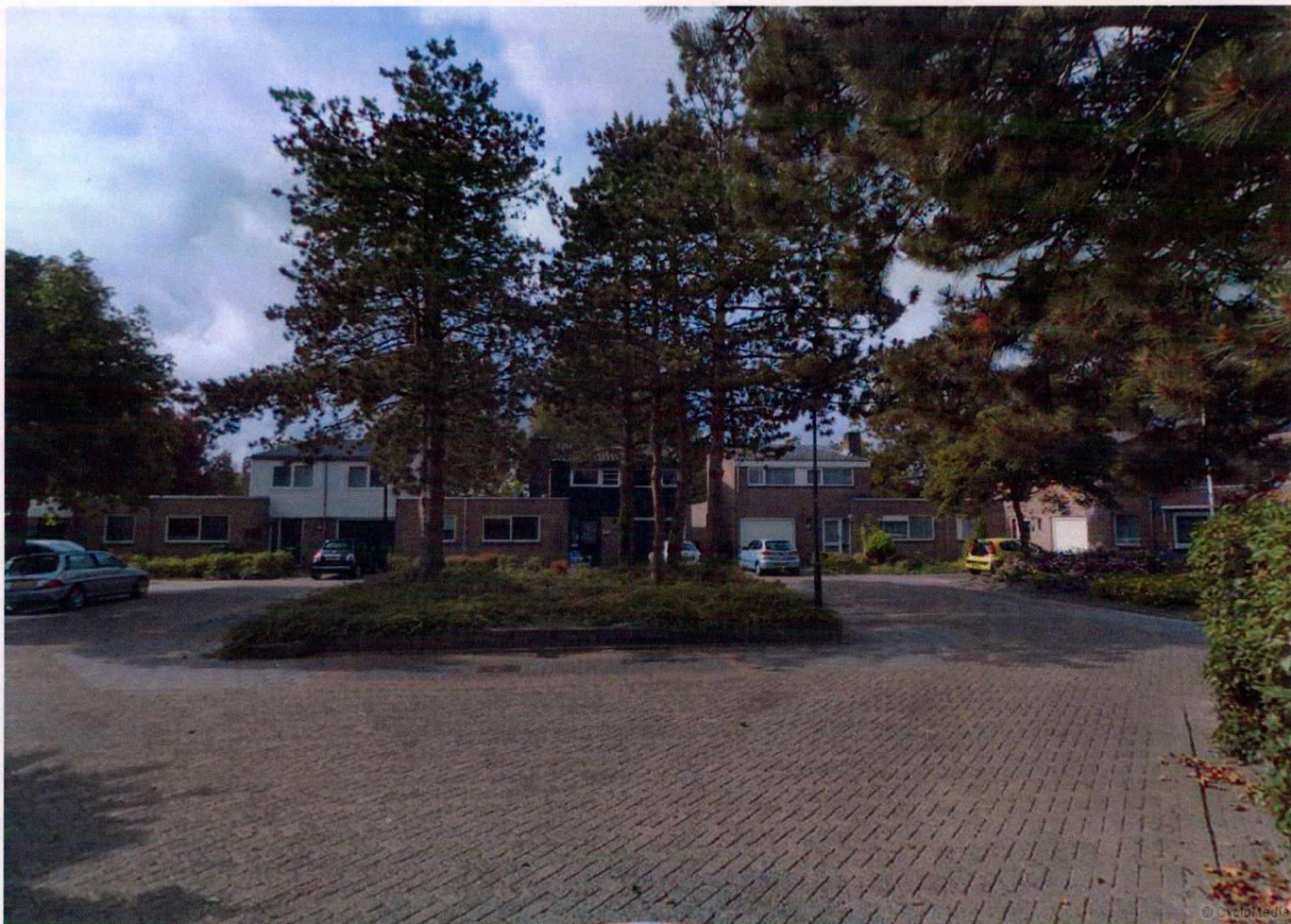
Figuur. 1: De situatie op het hofje

Op het hofje bij de Van der Helstlaan 2 – 22 staan zes dennen. Deze dennen geven overlast. In 2009 is met de bewoners afgesproken dat als er in de toekomst een meerderheid voor het kappen van de dennen is, een heroverweging zal plaatsvinden. Na een hernieuwde aanvraag in juli 2013 is er een enquête uitgegaan naar de belanghebbenden om een duidelijk beeld te krijgen wat de bewoners van het hofje willen. Er is nu een heroverweging met uitkomst.