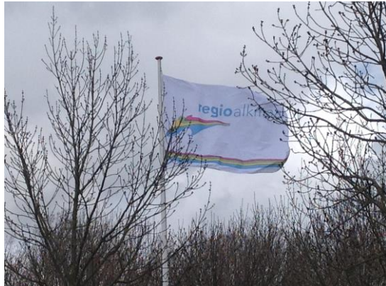
Regiodag 1 april 2015 Duurzaamheid bij HVC