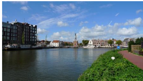
Regiodag 30 september 2015 in De oude Keuken