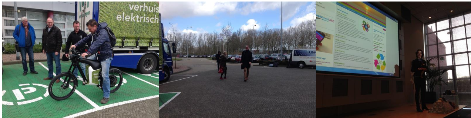
3 x Regiodag 2015#1 op terrein van HVC