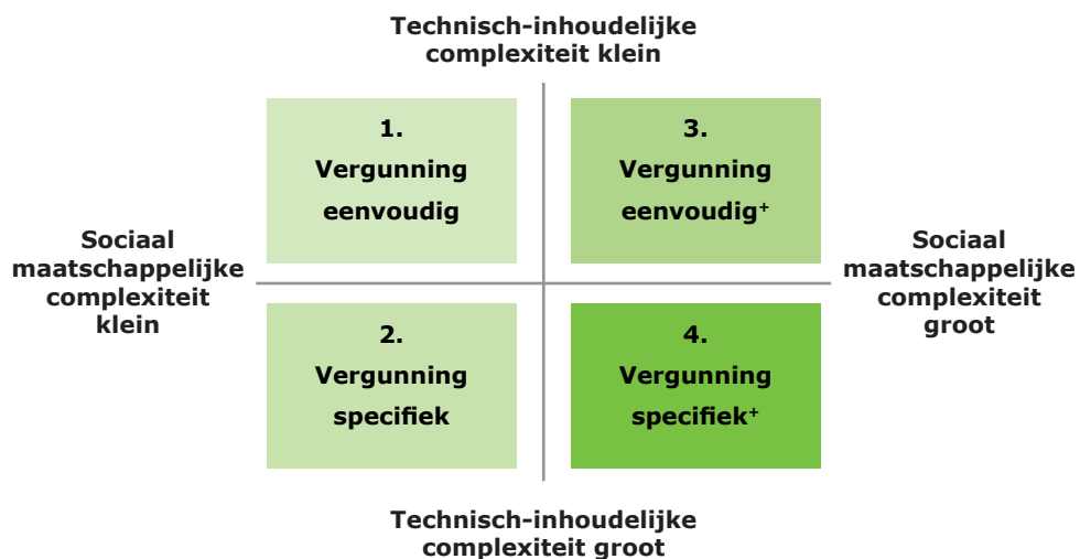
Figuur 1 – Vier typen vergunningen, afhankelijk van de technisch-inhoudelijke en sociaal-maatschappelijke complexiteit van de specifieke situatie van de inrichting of activiteit en/of het gebied waarin de inrichting is gevestigd of de activiteit plaatsvindt.

De vergunningen en meldingen worden langs de assen van Technisch-inhoudelijk complex en Sociaal maatschappelijk complex gelegd. Zie onderstaande figuur uit de VTH-strategie.