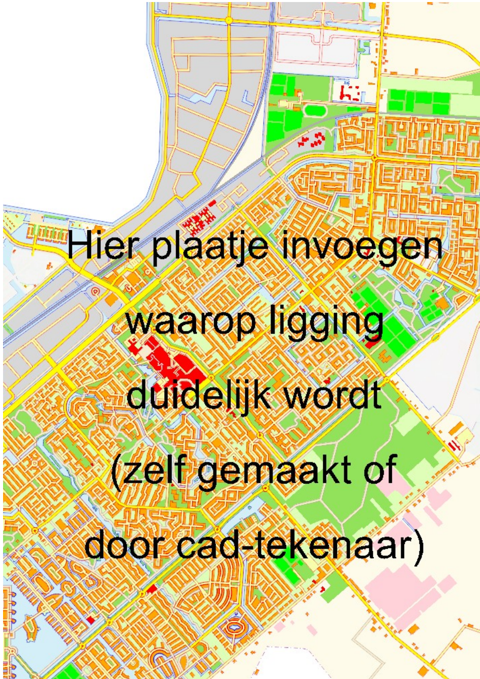
Figuur 1 Ligging van het plangebied