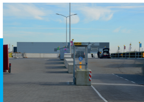
Afvalbrenngstation in Oudkarspel