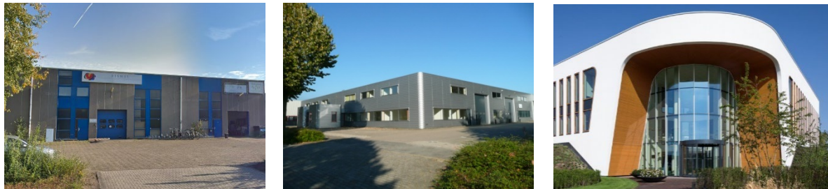
Figuur 3: Voorbeelden functioneel (links), functioneel/modern (midden) en hoogwaardig (rechts)