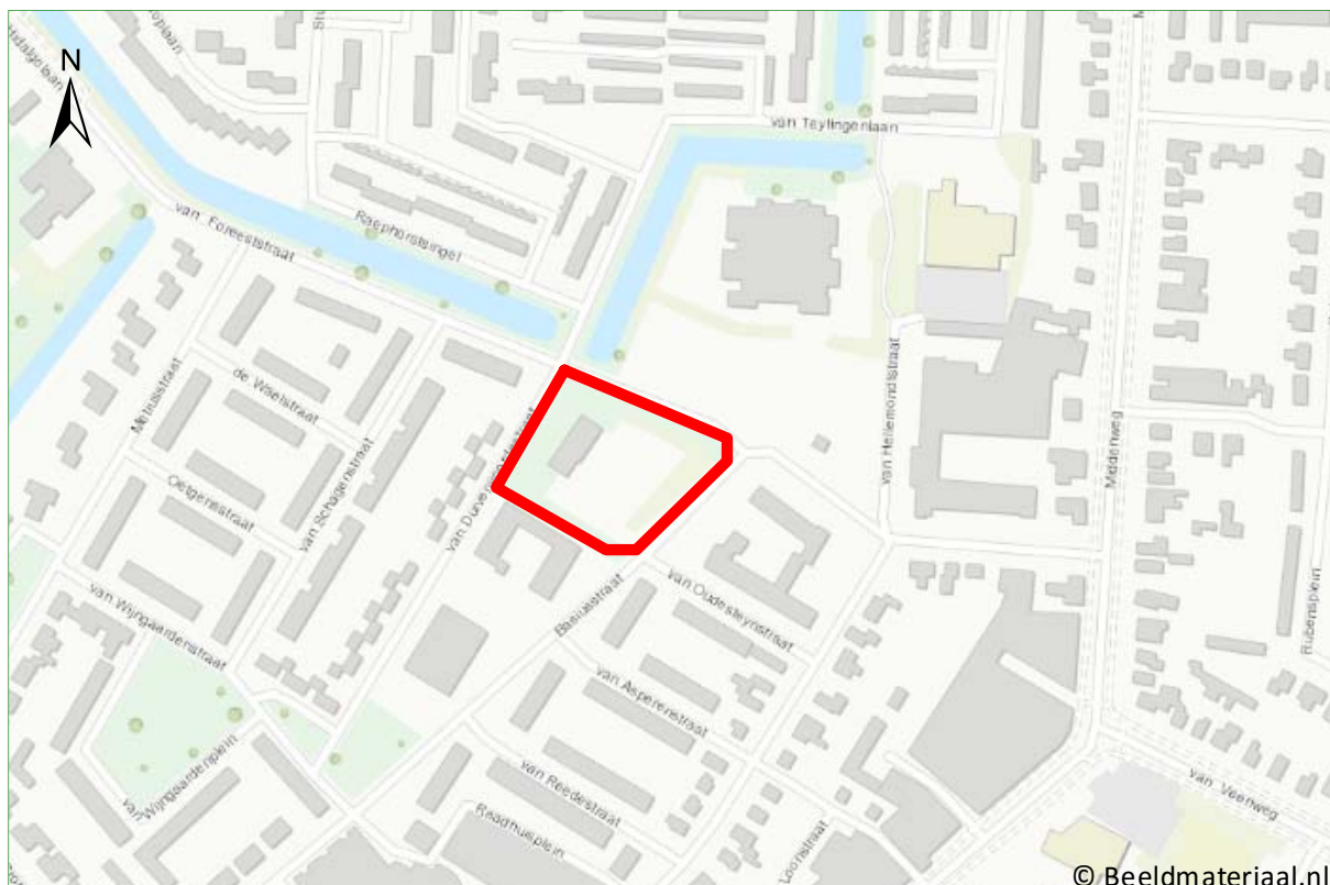
Figuur 1. Ligging van plangebied Van Duivenvoordestraat.

Doel van het onderzoek is om inzicht te krijgen in het (mogelijke) voorkomen van beschermde soorten in het kader van de Wnb. Tevens wordt onderzocht of de plannen negatieve effecten op dergelijke soorten en/of op beschermde gebieden kunnen veroorzaken.