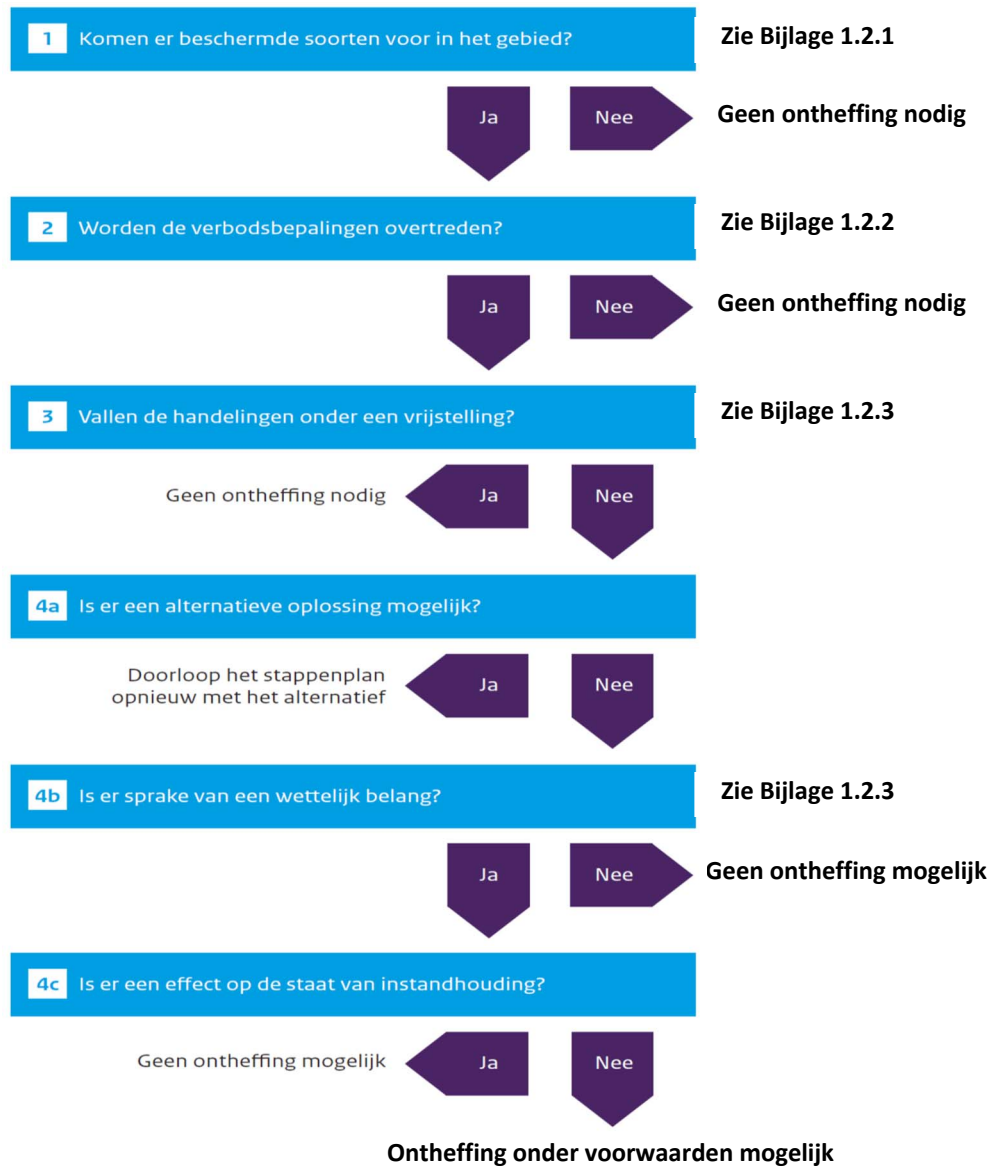
Figuur 3. Stappenplan procedure ecologisch onderzoek en ontheffing