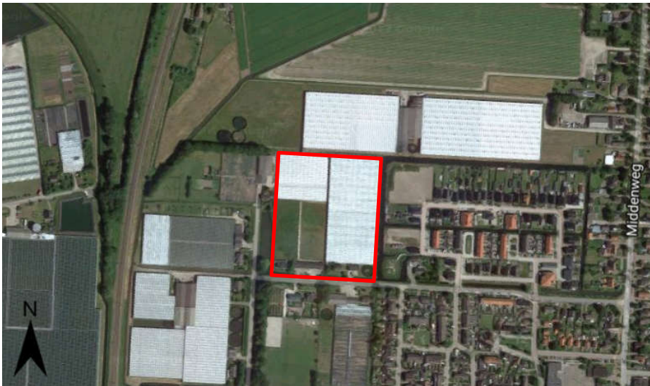
Figuur 1.1: Ligging plangebied