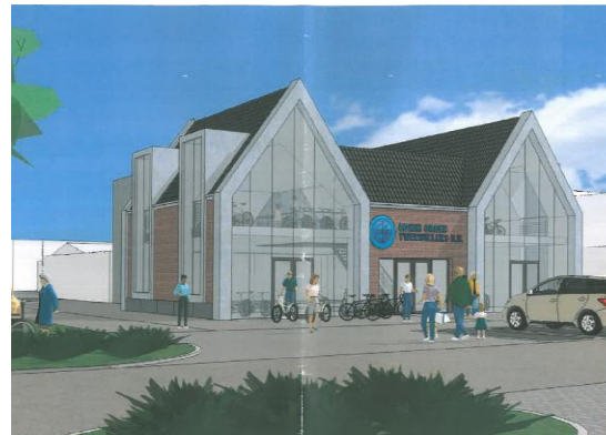
Definitief ontwerp Breddels architecten

Fietsenwinkel Edwin Groen is zeer bekend. Deze grote winkel is nu gevestigd in diverse bestaande panden aan het lange lint van de Middenweg. Het plan bestond uit een nieuwe grote winkel ter vervanging van de bestaande panden. Vanwege de ligging aan het lint met een kleinschalige korrel, was het belangrijk dat het nieuwe gebouw zich hierin voegde. Het eerste ontwerp hield geen rekening met de gewenste stedenbouwkundige korrel. De commissie heeft zich sterk gemaakt om dit te verbeteren. De opdrachtgever heeft uiteindelijk met het inschakelen van een andere ontwerper wel een goed plan kunnen presenteren. Het verschil tussen het eerste ontwerp en het uiteindelijk goedgekeurde ontwerp is zeer groot. De commissie was dan ook zeer verheugd dat haar inspanning resultaat heeft opgeleverd.