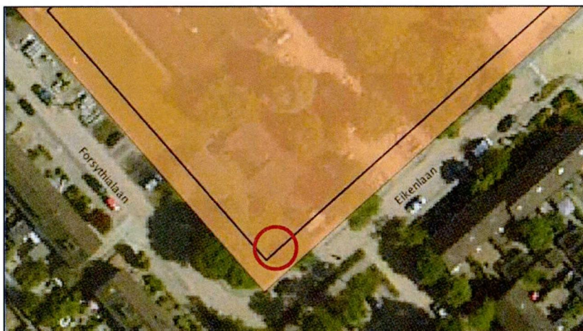
Afbeelding 1: Uitsnede ontwerpbestemmingsplan met locatie van het gasdrukmeet- en regelstation (rode cirkel).