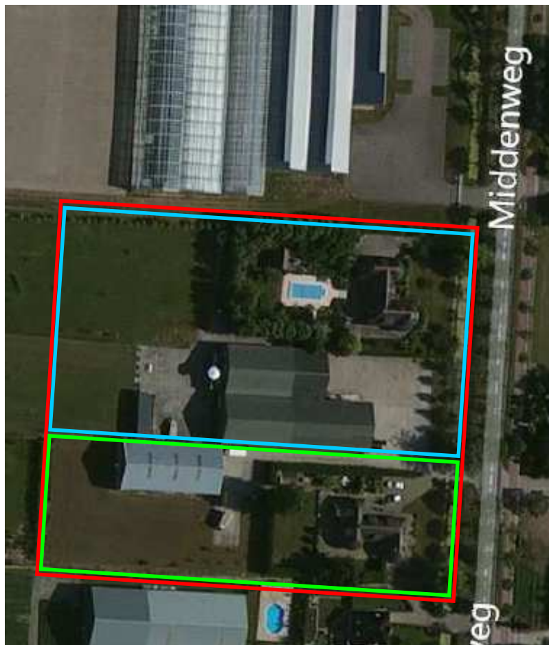
Satellietfoto Middenweg 591 en 591a