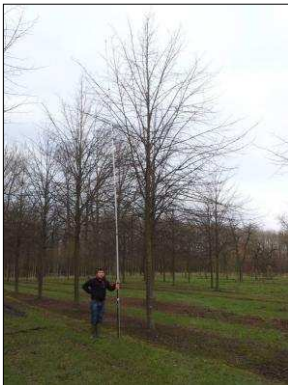
Figuur 1, Kroningslinde (boomhoogte 9 meter)

De voorgestelde diameter is 2,00 meter i.t.t. de aanbieding in bijlage C van 1,20 meter. De reden hiervan is dat bij de uitstraling van een grote boom van 9 meter een robuust en degelijk hekwerk wenselijk is.