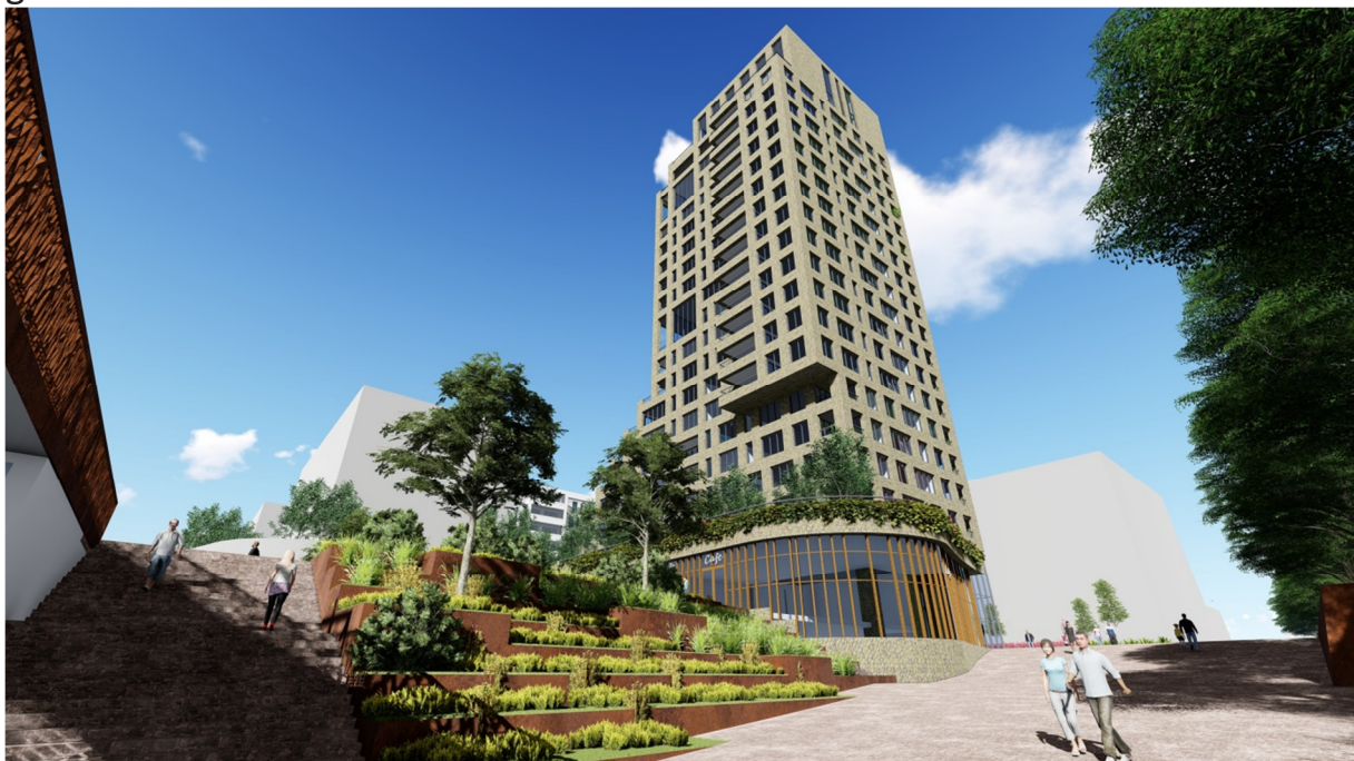
Toekomstige onderdoorgang stationsweg

Wij hebben het voorontwerp van de woon- en zorgtoren op 17 juli jl. in de raadzaal gepresenteerd aan een ieder die hier geïnteresseerd in was. Het college en de buurt hebben toen reeds een preview van de ontwikkeling gezien.