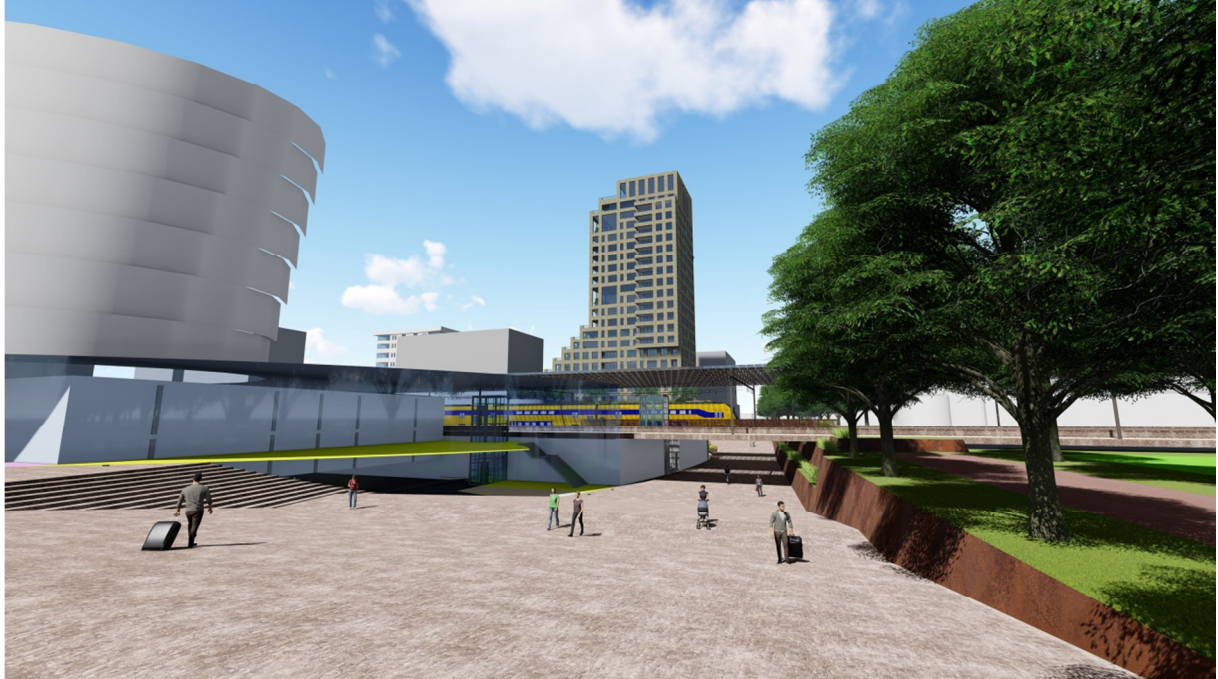
Toekomstige onderdoorgang stationsweg

We staan nu op het punt verder te gaan met de uitwerking tot een definitief ontwerp en willen u graag meenemen in deze momentopname van de verdere ontwikkelingen.