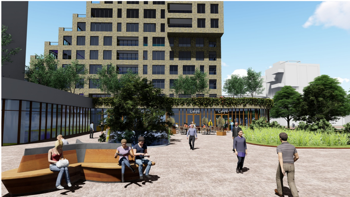
Toekomstig stationsplein landschapszijde

Tussen station en de openbare plint van de woontoren kan in de nabije toekomst een gezellig stationsplein aan de landschapszijde worden gerealiseerd waarvoor wij reeds een aanzet meegeven.