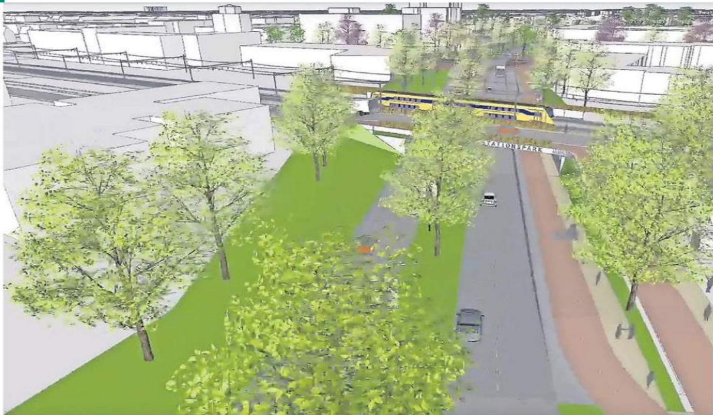
Impressie van de spooronderdoorgang, gezien vanuit de richting Langedijk.

Nee, als er al serieus weerwerk komt, dan gaat dat over geld. De raad wordt gevraagd om een moddervet spaarvarken ergens op een plank te zetten met daarop een briefje 'Afblijven! Is voor tunnel.' Dan staan er miljoenen ongebruikt in een donker hoek-