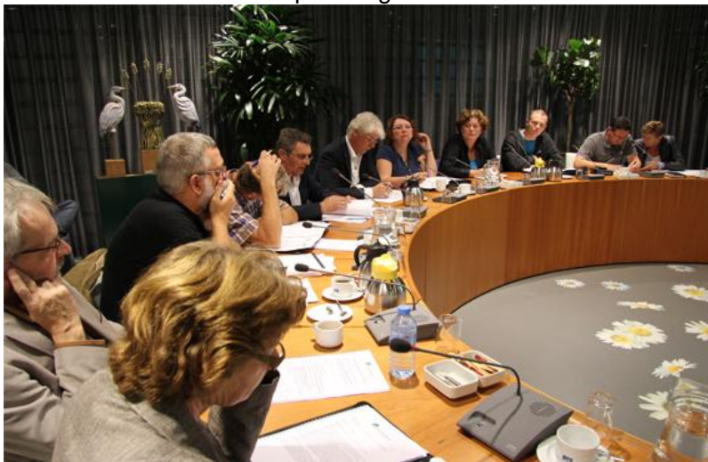
Gemeenteraad van Heerhugowaard

Toetsing en kwaliteitsbewaking van zowel uitvoering als beleidsontwikkeling zijn onderdeel van de gemeentelijke regierol. Graag geeft de gemeente hier binnen ruimte aan participatie en laat zij zich adviseren door de inwoners en organisaties. Daartoe zijn verschillende participatieorganen, zoals de Cliënten Advies Raad, en inspraak- en klachtenregelingen beschikbaar.