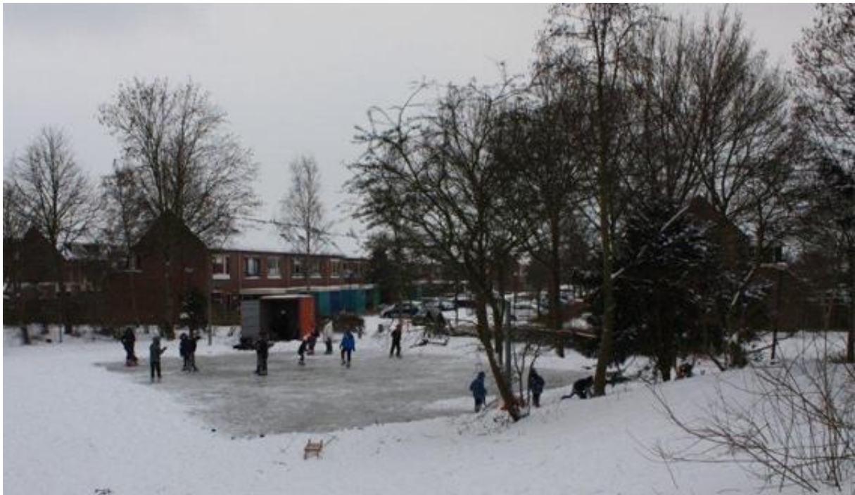
IJsbaan in Rivierenwijk, februari 2012

Kracht van burgers is overal in Heerhugowaard zichtbaar. Heerhugowaarders zetten zich in voor hun eigen welbevinden, maar ook voor dat van anderen. Burgers zijn gemotiveerd om in hun woon- en leefomgeving bij kansen en knelpunten de handschoen op te pakken. Zo ontstaan er tal van burgerinitiatieven en ontwikkelingen waarin de burger als (co-)producent participeert. Daarbij past een terughoudende stijl van de overheid en maatschappelijk veld. Deze initiatieven moeten dan ook zo veel als mogelijk bij de burgers zelf worden gelaten.