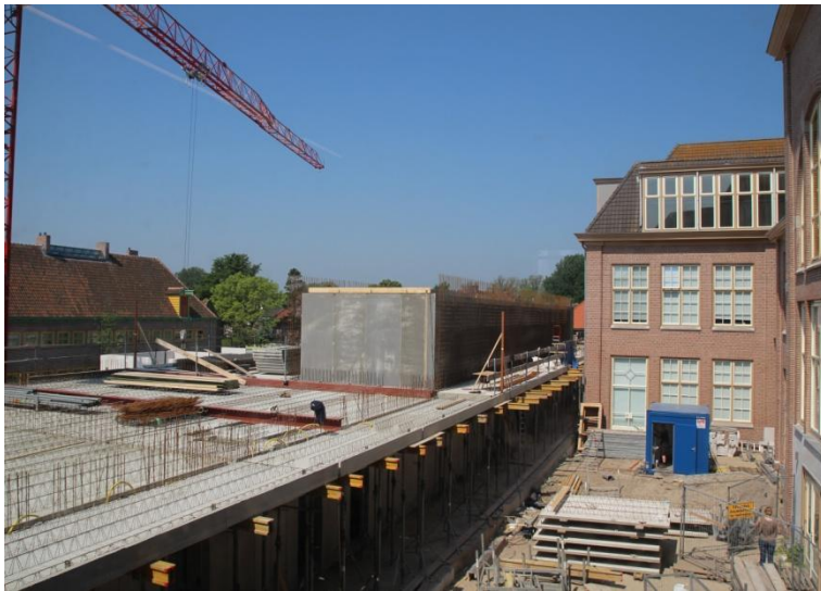
Het nieuwe depotgebouw, halverwege en eind 2012

De archieven bevonden zich in 2012 nog in het oude depot aan de Hertog Aalbrechtweg. Het transport van de stukken tussen de twee locaties is zonder problemen verlopen.