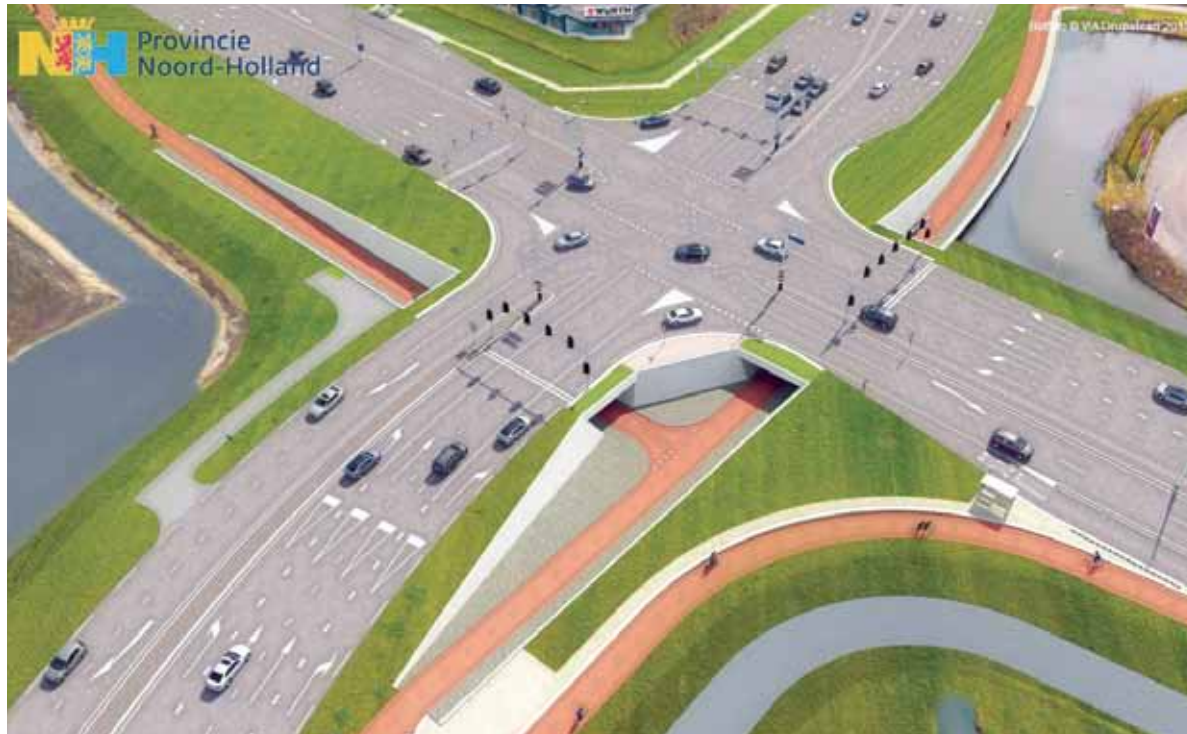
■ Nieuwe situatie

De herinrichting van het kruispunt moet de doorstroming van het verkeer op de N242 verbeteren. Er komen meer en langere opstelstroken voor rechtdoor en afslaand verkeer. Belangrijke winst voor de doorstroming wordt verwacht van twee fietstunnels die worden aangelegd. Er komt een tunnel onder de Broekerweg en één onder de N242.