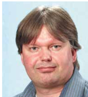
dienen daarbij verminderd te worden.

Wel vinden wij dat de innovaties op het gebied van duurzaamheid gedaan dienen te worden door het bedrijfsleven, eventueel in samenwerking met het (wetenschappelijk) onderwijs. Wij zien dit niet als primaire taak van de overheid. De gemeente moet het bedrijfsleven juist ruimte en vrijheid geven om te kunnen investeren in duurzame technieken. Belemmerende regels