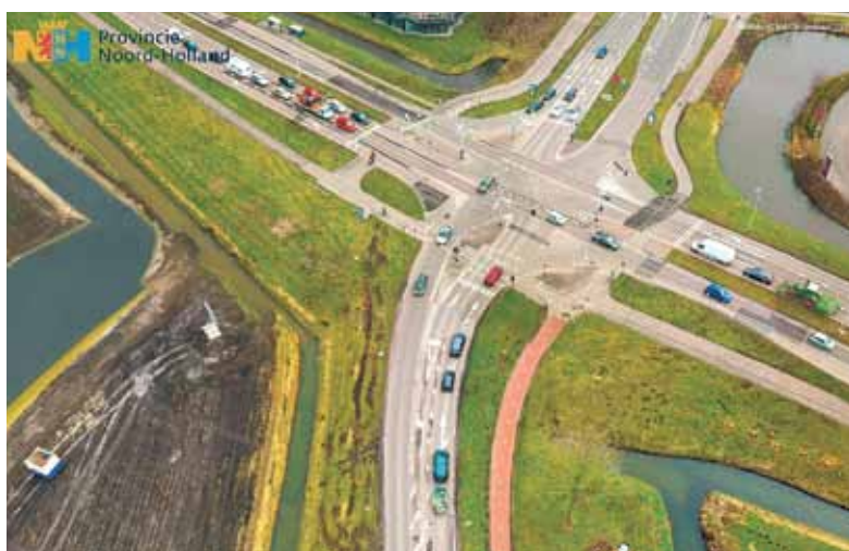
■ Bestaande situatie

Is dat nou wel nodig: een fietstunnel onder de N242 en ruim honderd meter verder een fietsbrug over diezelfde N242? Ja, zegt de gemeente. Die wil op de Zuidtangent zo weinig mogelijk overstekend langzaam verkeer. Dat wordt deels bereikt doordat de fietspaden aan beide zijden tweerichtingsverkeer zijn (de fietspaden tussen de Bevelandseweg/Stationsplein en de N242 worden dat in de toekomst ook). De fietsbrug is in de toekomst bedoeld voor fietsverkeer dat in het Stationsgebied en de scholen aan de Umbriëlaan en verder moet zijn. De fietstunnel onder de N242 is voor fietsverkeer met overige bestemmingen. Daarmee wordt het oversteken van de Zuidtangent tot een minimum beperkt.