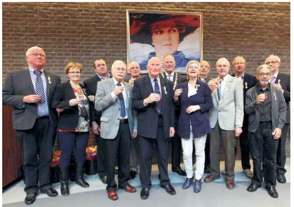
■ De gedecoreerden 2013

Het duurt nog even voor het weer zover is, de jaarlijkse lintjesregen: op vrijdag 25 april 2014 worden de koninklijke onderscheidingen uitgereikt. Iedere inwoner van Nederland kan een lintje aanvragen voor een ander. Dat moet wel voor 1 augustus gebeuren. Wie iemand wil voordragen voor een lintje doet er verstandig aan vooraf even contact op te nemen met de gemeente, waar ze kunnen vertellen of de verdiensten inderdaad bijzonder genoeg zijn voor een koninklijke onderscheiding en zo ja, hoe het dan verder gaat.