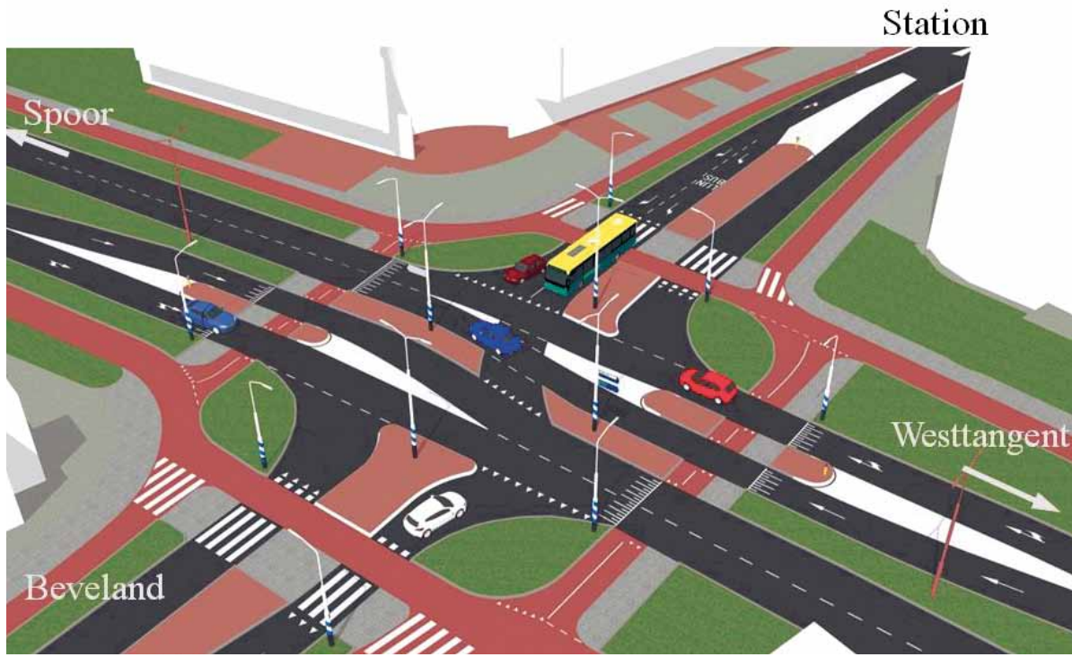
■ Idee van de gemeente

Sluit de Bevelandseweg vanaf de Zuidtangent gewoon af. Kost weinig geld en probleem gegarandeerd opgelost. Nee, verkeerslichten. Of toch maar op de Umbriëllaan eenrichtingsverkeer vanaf de Westtangent. Aan ideeën van bewoners geen gebrek tijdens een informatieavond op 27 mei in het gemeentehuis. De gemeente heeft ook een idee. Het kruispunt Zuidtangent-Bevelandseweg/Stationsplein is al jaren een zorgenkind als het gaat om verkeersveiligheid en doorstroming. Een ongelijkvloerse kruising in combinatie met een tunnel onder het spoor is misschien nog wel de beste oplossing, maar zover is het nog niet. Wel zijn op het gemeentehuis de voorbereidingen voor in ieder geval een tunnel onder het spoor inmiddels begonnen. 'Zo'n tunnel zou er in 2018 kunnen zijn', zei wethouder Stam die ook Verkeer in haar portefeuille heeft. Tot het zover is wil de gemeente naar een tijdelijke oplossing voor de problemen op het kruispunt. 'De gemeenteraad heeft daarom gevraagd', aldus de wethouder. De gemeente presenteerde op 27 mei een mogelijke oplossing: maak linksaf slaand verkeer vanaf de Zuidtangent en kruisend verkeer over de Zuidtangent onmogelijk en hef het zebrapad over de Zuidtangent op. Dus niet meer linksaf vanaf de Zuidtangent naar het Stationsplein en de Bevelandseweg. En ook niet