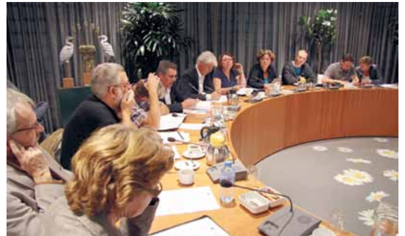
Agenda raads- en commissievergaderingen

is uitgesteld in de Voorjaarsnota wordt die uiteindelijk vastgelegd in de gemeentebegroting. Op de vergadering wordt stevig gedebatteerd tussen de verschillende politieke partijen. Over de belangrijkste onderwerpen informeren wij u over twee weken op deze raadspagina van het Stadsnieuws. U kunt de vergadering ook bezoeken; de Voorjaarsnota wordt op 20 juni vanaf 9.15 uur behandeld in de raadszaal van het gemeentehuis. Het debat is ook live op internet te volgen via raad.heerhugowaard.nl .