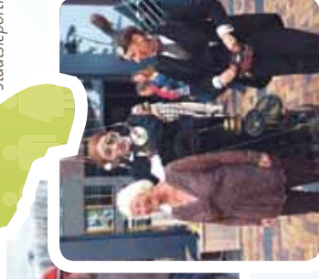
Opening cultureel seizoen