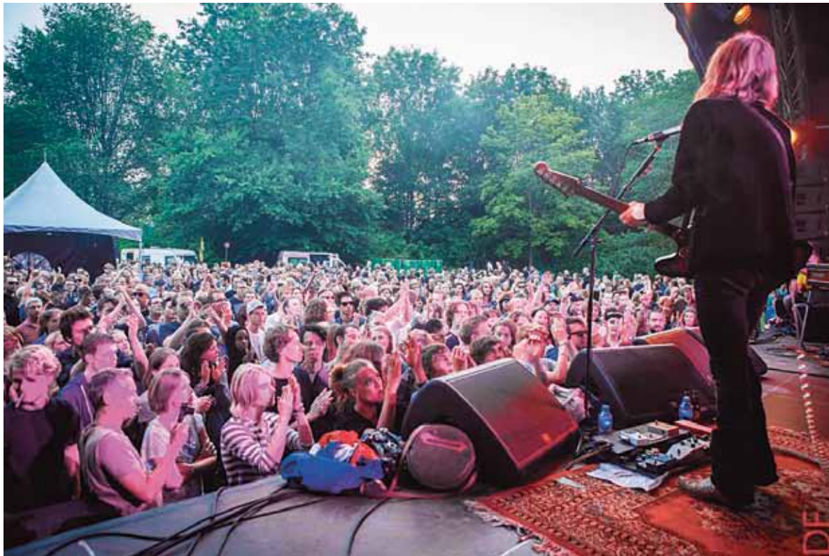
■ Mooi weer tijdens Mixtream 2013, dus veel publiek

Op het festivalterrein zal dit jaar aan de waterkant een grote Jeep te vinden zijn. Dit is het startpunt van