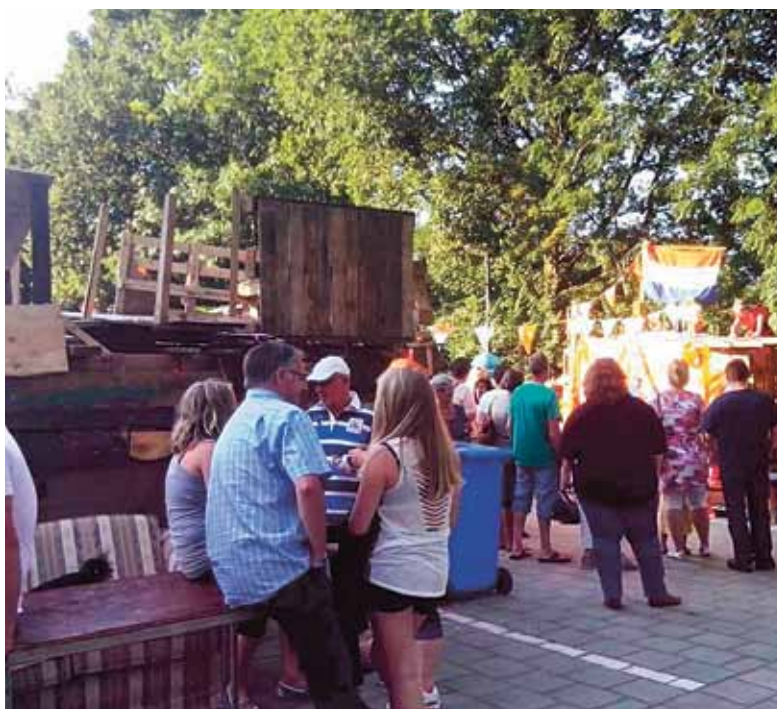
■ In 2015 ook nog huttenbouw?

Want vaak is het zo dat de instelling die voor de laagste prijs kan werken, een aanbesteding wint. Dat betekent dat er minder kan,