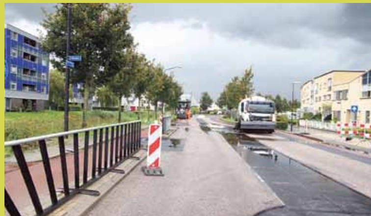
■ Asfalteringswerkzaamheden Westfrieslandsingel