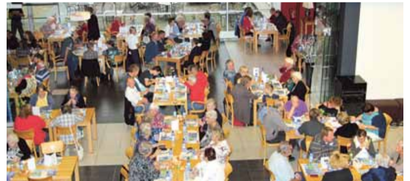
De eerste langste tafel in 2012

positieve actie wil de gemeente Heerhugowaard aandacht vragen voor het groeiend probleem van eenzaamheid onder de bevolking in Nederland. Coalitie Erbij zet zich het hele jaar in voor de strijd tegen eenzaamheid en organiseert nu voor het 5e achtereenvolgende jaar de Week tegen Eenzaamheid. Dit jaar is het thema '(H)erken eenzaamheid, handel op tijd. Daarmee ondersteunt Coalitie Erbij het belang van tijdig signaleren en bespreekbaar maken van eenzaamheid.. In de Week tegen Eenzaamheid zijn er allerlei activiteiten in het